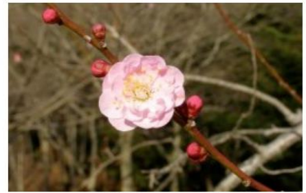
江南所無（こうなんしょむ）

遅咲きの時期の楽しみ方は“送梅”。遅く咲き始めた梅の香りを楽しみながら、去りゆく梅の季節を見送みましょう。