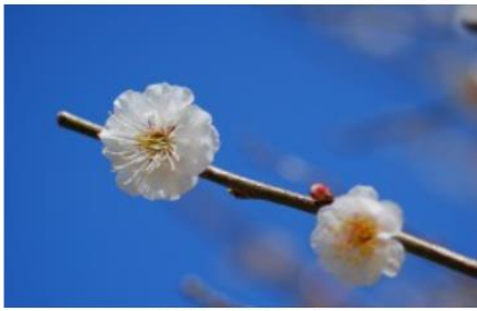
白難波（しろなにわ）

早咲きの時期の楽しみ方は“探梅”。まだ固い蕾が多い中、ほころんだ梅の花を一輪一輪探しながら散策してみましょう。